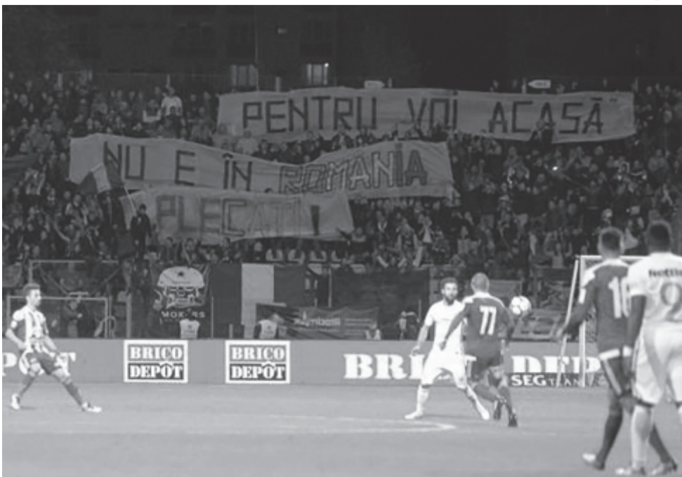
A Seps OSK és a Bukaresti FCSB 2017. október 1-jén, Brassóban rendezett mérkőzésén a bukaresti csapat szurkolóinak egy csoportja óriásmolinót feszített ki azzal a felirattal, hogy „Nektek Románia nem az otthonotok! Menjetez innen!” A provokációra a sepsiszentgyörgyi csapat szurkolói „Ria-Ria-Hungária!” skandalással válaszoltak. Az FRF fegyelmi bizottsága mindkét csapatot azonos bírsággal sújtotta

Egy évvel azután, hogy percekre volt története első bajnoki címétől, dicstelensül búcsúzott a román élvonalbeli labdarúgó-bajnokságtól a Marosvásárhelyi ASA. A városi támogatások megvonása nyomán tönk szélre sodródott klub csapata folyamatos átalakuláson ment át, edzők és játékosok adták egymásnak a kilincset, és bár a másodosztályt még azzal az eltökélt elhatározással kezdték, hogy feljutást érő helyen zárják a szezont, az ősszel kimondták a sportszervezet csődjét, így – bár az őszi befejezés még megadatott az alakulatnak – a 2018-as folytatás már több mint kétszázéves.