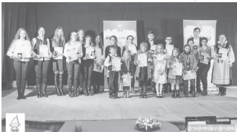
A díjazottak egy csoportja