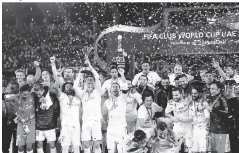
Cristiano Ronaldo magasba lendíti a klubvilágbajnoki trófeát. A portugál futballista az első játékos a történelemben, aki két egymást követő döntőben is gólt szerzett

Az ötszörös aranylabdás támadó, Cristiano Ronaldo az első játékos a történelemben, aki két egymást követő klubvilágbajnoki döntőben is gólt szerzett. Ráadásul hét gólnál tart ebben a sorozatban, ugyanúgy, mint a jogelőd Interkontinentális Kupában a brazil Pelé. Egyébként a Real Madrid az első csapat a történelemben, amely képes volt megvédeni klubvilágbajnoki címét – a királyi gárda a BL-ben is címet védett, emellett megnyerte a La Ligát, a Spanyol és az Európai Szuperkupát is. Zidane 2016 januárja óta ve-