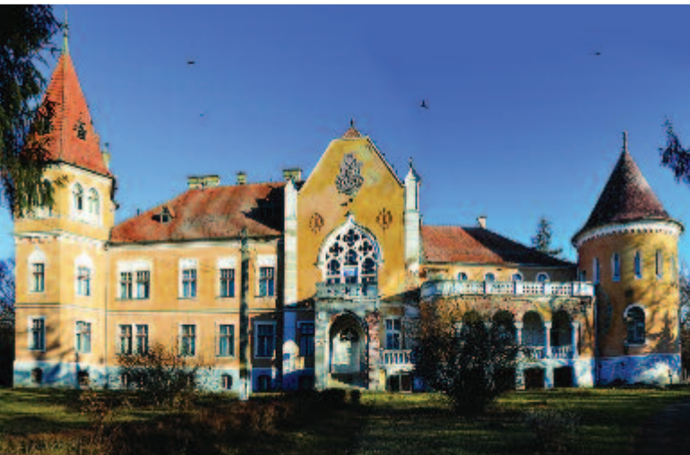
A mezőzáhi Ugron-kastély

Pusztakamaráson született Sütő András. A Kossuth- és Herder-díjas író szülőháza 2013-ban került magyar közösségi tulajdonba, miután az erről szóló adásvételi szerződést az Erdélyi Magyar Közművelődési Egyesület (EMKE) és az RMDSZ aláírta az örökösökkel. 2015 októberétől a felújított Sütő András-emlékház művelődési központként is működik.