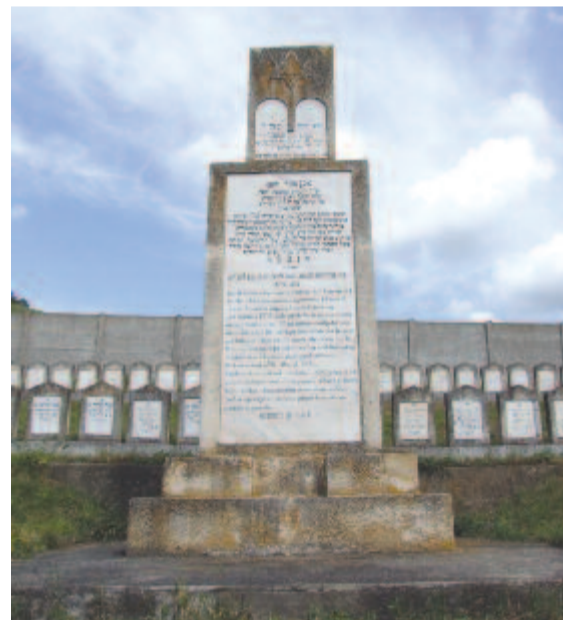
A pusztakamarási határban legyilkoltak emlékoszlója