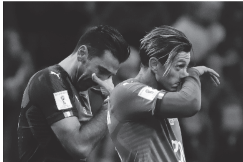
Olaszország csapata hatvan év után nem jutott ki a labdarúgó-világbajnokságra, a kapus Buffon zokogva búcsúzott

A sajtó azóta még több figyelmet szentel neki, írtak már arról, hogy összekulcsolták a csapatot Unai Emery edzővel is, a legfrissebb pletykák szerint pedig nem is érzi jól magát a francia fővárosban, és visszatérne inkább Spanyolországba. De nem korábbi klubjához, az FC Barcelonához, hanem a Real Madridhoz. Az biztos, hogy a madridiak el-